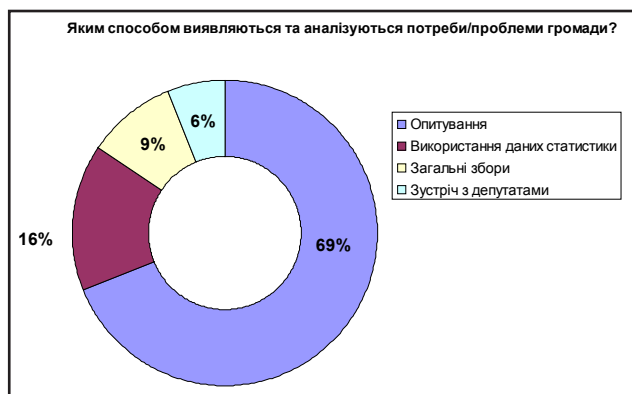
Рис. 2. Розподіл відповідей на запитання «Яким способом виявляються та аналізуються потреби / проблеми громади?» (N = 34; у % до загальної кількості)

Дослідження рівня розвитку управління громадою , наприклад, вивчення механізмів дії місцевих ініціативних груп, здійснювалося для виявлення у партнерських громадах потенціалу впровадження місцевих ініціатив такими групами з метою швидшої та більш ефективної адаптації вимушених переселенців. Як бачимо (рис. 2), механізми виявлення та аналізу проблем населення у більшості приймаючих громад були традиційно малорозвинутими та здебільшого обмежувалися неформальним опитуванням думки і використанням даних статистики у документах. Таким чином, у громадах до масового притоку переселенців майже не проводилося цілеспрямованої роботи щодо залучення громадськості до участі у плануванні та управлінні.