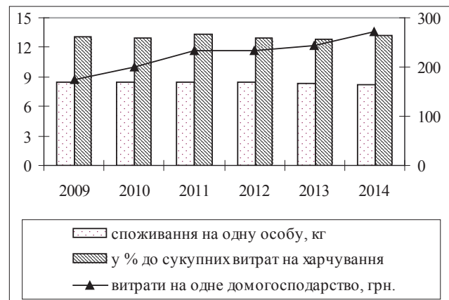
Рис. 1. Споживання хліба та хлібопродуктів міськими домогосподарствами та грошові витрати домогосподарств на основний вид продовольства протягом 2009–2014 рр.

Стосовно витрат міських та сільських домогосподарств, то необхідно зауважити, що у витратах міських домогосподарств (рис. 1) спостерігалася аналогічна картина, як і по Україні в цілому, хоча у 2012 р. витрати на хліб та хлібопродукти в міських домогосподарствах були меншими порівняно з попереднім роком.