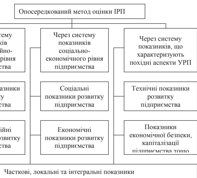
Рис. 4. Основи опосередкованого методу оцінки інноваційного розвитку підприємства

1) на базі фінансових можливостей підприємства обґрунтовану політику управління інвестиціями;