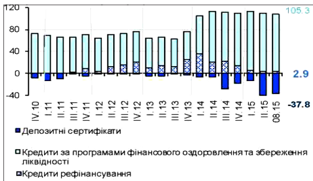
Рис. 3. Операції з регулювання банківської ліквідності, млрд грн [7]

Унаслідок значних обсягів розміщення коштів на депозитних сертифікатах середньоденні обсяги кореспондентських рахунків банків у II кварталі 2015 року знизилися до 24,1 млрд грн, що майже на 21% менше порівняно з попереднім кварталом, та залишалися практично незмінними в липні-серпні 2015 року (23,8 млрд грн). Крім того, слабка економічна активність та висока альтернативна вартість утримання ліквідних коштів спричинили суттєве зниження попиту на готівку. У II кварталі 2015 року обсяги готівки зросли лише на 0,9%, а протягом липня-серпня – зменшилися на 3,2% (у річному вимірі обсяги готівки знизилися на 4,7% станом на кінець серпня 2015 року). Як наслідок, монетарна база станом на кінець II кварталу знизилася на 5,9% у річному вимірі та на 3,7% станом на кінець серпня 2015 року.