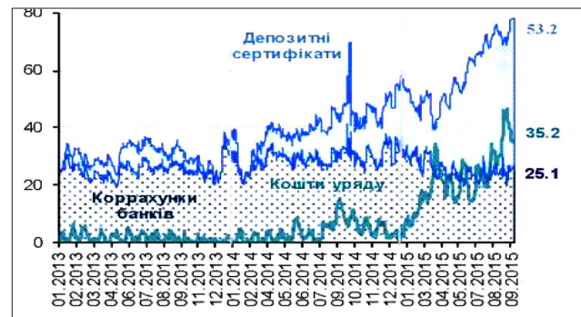
Рис. 2. Окремі показники ліквідності банківської системи станом на 01.10.2015 [7]

– операції Національного банку з іноземною валютою (за винятком операцій із НАК «Нафтогаз України»), чистий додатний вплив яких оцінено у розмірі 9,5 млрд грн у II кварталі 2015 року та 3,0 млрд грн у липні-серпні 2015 року.