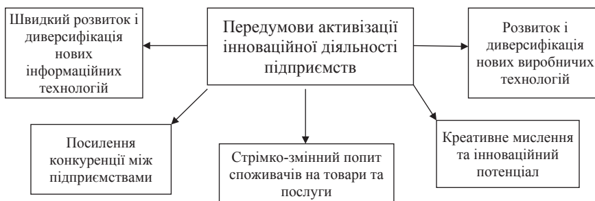
Рис. 1. Фундаментальні передумови активізації інноваційної діяльності підприємств

- формування якісно нової організації взаємозв'язків і взаємодії між усіма учасниками інноваційного процесу, встановлення нових функцій за відповідними органами управління як на державному, так і регіональному рівнях;