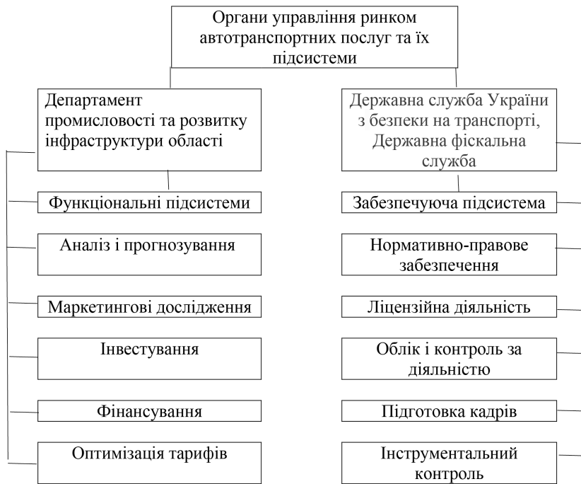
Рис. 3. Функції управління ринком автотранспортних послуг

З урахуванням викладених позицій, а також особливостей функціонування автомобільного транспорту України та регіонів модель управління ринком автотранспортних послуг можна представити у вигляді схеми (рис. 2)