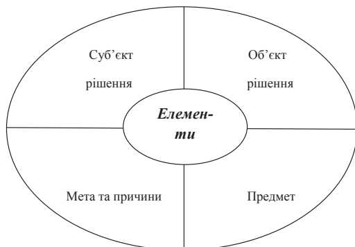
Рис. 1. Основні елементи господарського рішення

Будь-яке господарське рішення передбачає наявність обов'язкових елементів: предмет – що конкретно розглядається; мети і причин розробки рішення, суб'єкта – той, хто приймає рішення та об'єкта – виконавець рішення [1, с. 18] (рис. 1).