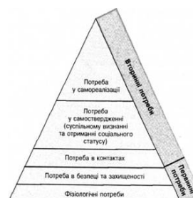
Рис. 2. Піраміда потреб А. Маслоу

Нині існує проблема правильного та ефективного мотивування співробітників в організаціях. При побудові системи мотивації персоналу керівнику необхідно задатися питанням не «як?», а «що?». Наприклад, не як провести навчальний семінар, а що він дасть? З якою метою його необхідно проводити? Що за підсумками цього семінару отримають співробітники і компанія в цілому? Підприємства з традиційною системою управління, як правило, використовують підхід – від часткового до загального. І дуже часто матеріальні та нематеріальні способи мотивації виникають і використовуються, не враховуючи при цьому реальні потреби бізнесу і очікування працівників. В інноваційних же компаніях такий підхід неприйнятний. Управління персоналом не піддається автоматизації, незважаючи на технологізацію усіх сфер діяльності організації. Перепрограмувати мозок практично неможливо. В інноваційних компаніях при розробці та впровадженні системи мотивації використовують індивідуальний підхід з опорою на технологію, особливо коли це стосується ключових співробітників. Усім відомі методики мотиваційної політики за А. Маслоу (піраміда потреб) (рис. 2) і система «Мотивація-стимул» В. Герчикова (рис. 3).