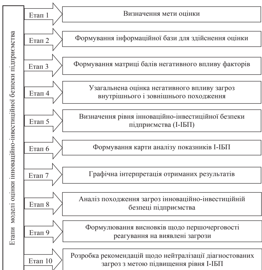
Рис. 1. Етапи моделі оцінки інноваційно-інвестиційної безпеки підприємства

\Pi_t – значення відповідного індикатора у поточному році;