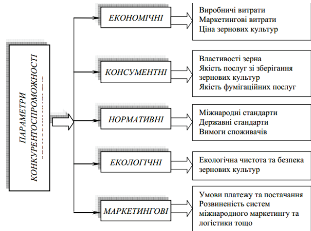
Рис. 2. Параметри конкурентоспроможності

параметрів: економічні, консументні, нормативні, екологічні, маркетингові (рис. 2).