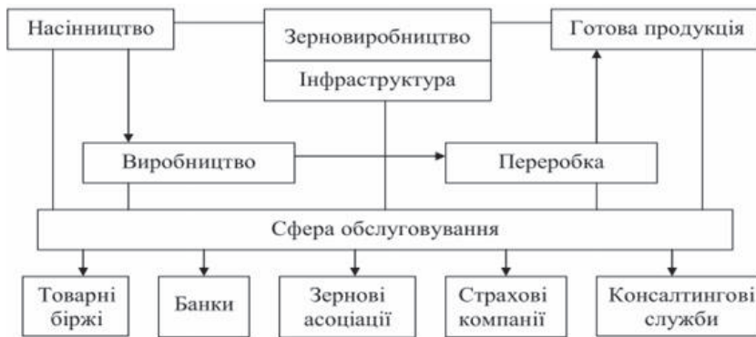
Рис. 1. Схема функціонування зерновиробництва в Україні

Для підвищення конкурентоспроможності зернового комплексу України на світовому ринку необхідно здійснювати низку заходів, які б сприяли розвитку даного виробництва. Насамперед суттєва державна підтримка виробника зерна; регулювання розвитку виробничої та ринкової інфраструктури; економіко-правове забезпечення зовнішньополітичної діяльності та зовнішньополітичне регулювання позиції зерна на світовому ринку. При цьому стратегія управління передбачає поступове зменшення державного впливу на процеси. Створення необхідних умов для ефективного виробництва, становить фундамент конкурентоспроможності зернових на світовому товарному ринку, забезпечує його ключові параметри: якість і ціну, а також регулює термін реалізації на відповідному ринковому сегменті та можливості просування зазначеного товару на інші сегменти світового ринку [3]. Важливість підвищення ефективності процесу виробництва актуалізується і тим фактором, що він забезпечує наявність значних