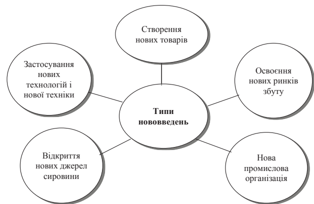
Рис. 1.2. Типи нововведень за Й. Шумпетером

Промислові революції періодично змінюють існуючу систему виробництва, викликаючи постійний потяг до нововведень. Економічна динаміка ґрунтується на поширенні нововведень у різних формах. Результатом подібних інновацій є вплив на економічні процеси або безпосередньо на продукцію. Й. Шумпетер розрізняє п'ять типів нововведень [9, с. 53; 10, с. 952–953]: створення принципово нових товарів та послуг; застосування нової техніки і технології, що передбачає впровадження нових методів виробництва і транспортування; завоювання нових ринків збуту продукції; поліпшення ресурсної бази шляхом відкриття нових джерел сировини; формування нової промислової (галузевої) організації – впровадження раціональних форм організації виробництва й управління, що відображені на рис. 1.2.