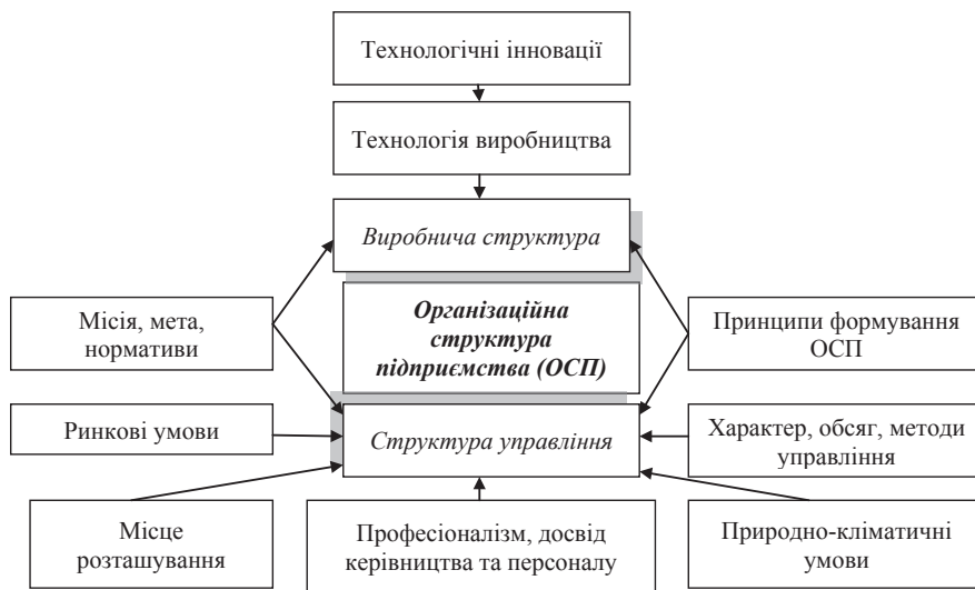
Рис. 1. Основні фактори, що впливають на організаційну структуру підприємства

N – число тимчасових періодів, що охоплюють життєвий цикл підприємства T . За однакової трива-