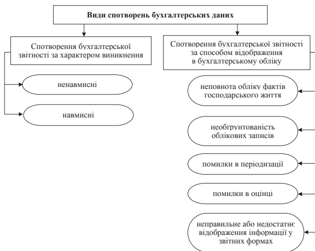
Рис. 1. Перелік спотворень бухгалтерських даних за видами

Обман може здійснюватися шляхом маніпулювання, фальсифікації і зміни записів на рахунках бухгалтерського обліку в облікових реєстрах або документах; навмисного неправильного віднесення до активів різних статей; знищення або пропуску записів або документів; відображення операцій без розкриття їх змісту тощо.