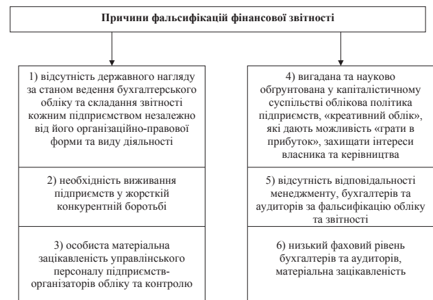
Рис. 3. Причини фальсифікацій фінансової звітності

Невиключена можливість здійснення подібних порушень під тиском особистих обставин співробітників, відповідальних за процес складання фінансової звітності. Наприклад, спотворення показників прибутковості може бути викликано зацікавленістю співробітників і менеджменту, оскільки отримання бонусів (комісій) залежить від фінансових результатів компанії [18].