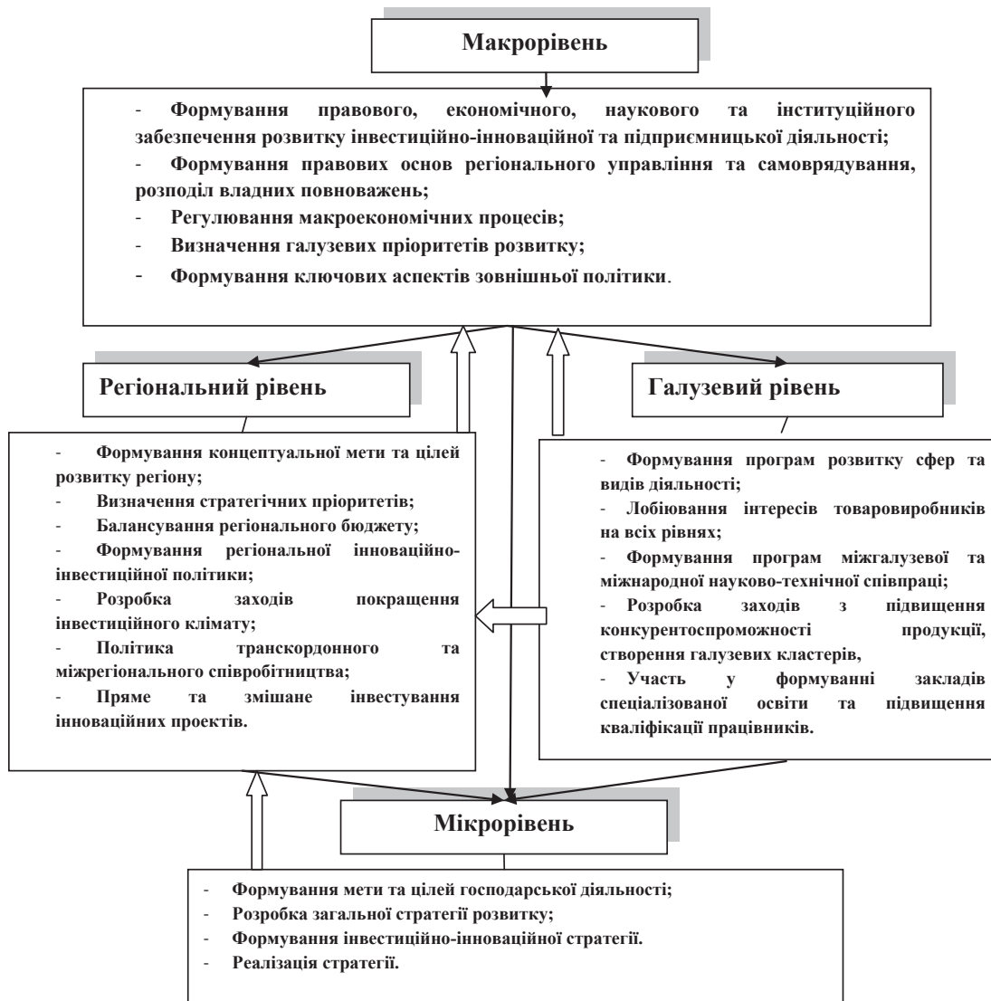
Рис. 2. Рівні та сфери формування інвестиційно-інноваційної стратегії