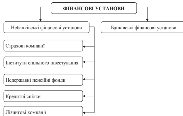
Рис. 1. Класифікація фінансових установ

У нашому дослідженні будемо спиратися на класифікацію фінансових установ, подану І. Школьник [9].