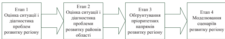
Рис. 2. Основні етапи вибору пріоритетних напрямків стратегічного розвитку регіону

новано здійснювати на основі наукового підходу за допомогою: матриці життєвого циклу і цілей розвитку регіону; нейросітових карт Кохонена; SWOT – аналізу стану галузей і виробництв.