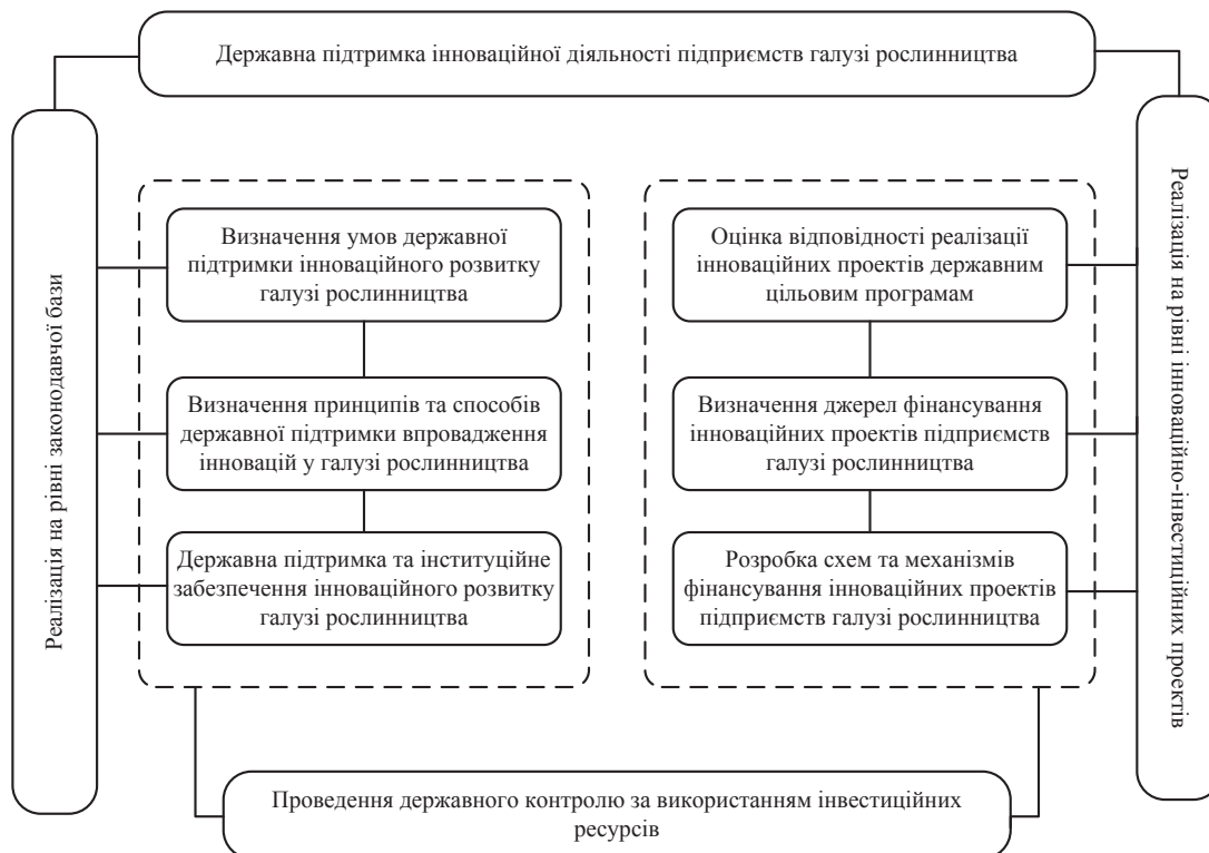
Рис. 1. Напрями реалізації державної підтримки інноваційної діяльності підприємств галузі рослинництва

прями, які забезпечують європейський рівень якості аграрної продукції, її конкурентоспроможність на внутрішньому і зовнішньому ринках [2]: