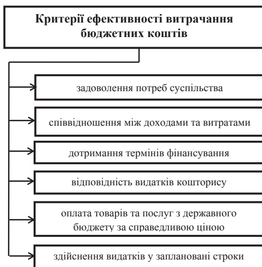
Рис. 4. Критерії ефективності витрачання бюджетних коштів [9, с. 78]

Бюджетне планування є складовою загальнодержавного економічного планування і займає центральне місце у фінансовому плануванні, тобто є невід'ємною частиною фінансового механізму держави. Відтак, від рівня збалансованості бюджету на стадії планування, точності прогнозів показників соціально-економічного розвитку залежать рівень виконання бюджетних програм протягом майбутнього бюджетного періоду, рівень ефективності управління бюджетними коштами та стабільність функціонування бюджетної сфери загалом.