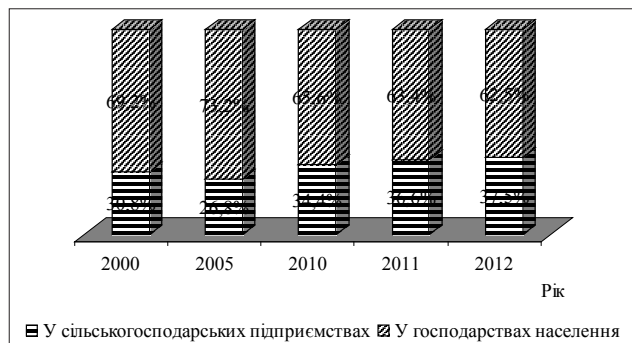
Рис. 1. Структура обсягу виробництва м'яса всіх видів у Хмельницькій області (2000-2012 рр.)

Основними виробниками м'яса в Хмельницькій області є господарства населення. Їх питома вага в структурі загального обсягу виробництва м'яса всіх видів (у забійній вазі) у 2012 р. становить 62,5%, однак має тенденцію до зниження – на 6,6 пункти порівняно з 2000 р., у тому числі на 0,9 пункти – проти 2011 р. (рис. 1).