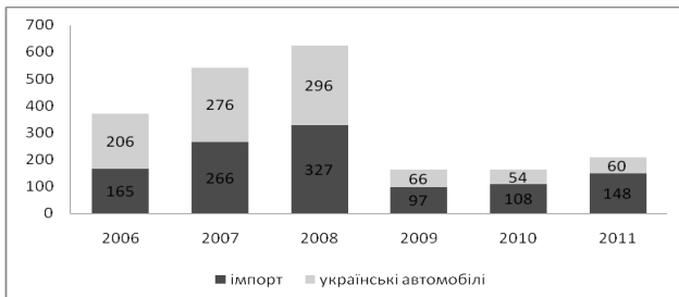
Рис. 2. Структура реалізації легкових автомобілів в Україні, тис. од. [7]

У 2012 р. на автомобільному ринку України було реалізовано 363,191 од. автотранспортних засобів, таким чином зростання склало 22%. Як бачимо, внесок вітчизняного автомобілебудування до національної економіки залишається несуттєвим. Зокрема, у 2012 р. частка галузі в промисловому виробництві становила менш як 0,8%, у створенні національного валового внутрішнього продукту – менш як 0,4%. У 2012 р. частка галузі в обсязі реалізованої промислової продукції становила менш як 1,2%. У виробництві автомобілів працює лише 19,3 тис. працівників, разом із суміжними галузями (виробництво комплектуючих та матеріалів) кількість зайнятих становить до 29,8 тис. працівників, або близько 0,1% усіх працюючих в Україні [1].