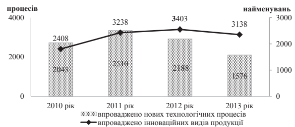
Рис. 1. Впровадження інновацій на промислових підприємствах за 2010–2013 роки

Динаміку впровадження промисловими підприємствами України інновацій у вигляді нових технологічних процесів та видів продукції за 2010–2013 рр. представлено на рисунку 1.