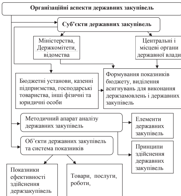
Рис. 2. Система державних закупівель

Побудовано організаційну систему державних закупівель, у якій виділено організаційні аспекти здійснення закупівель товарів і послуг (рис. 2).