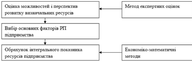
Рис. 1. Методично-практичні положення щодо оцінки ресурсного потенціалу підприємства

Методико-практичні положення щодо оцінки ресурсного потенціалу підприємства повинні базуватись на (див. рис. 1):