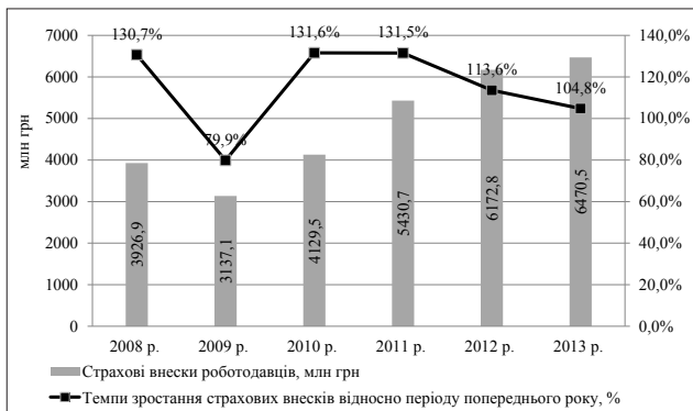
Рис. 2. Динаміка надходження страхових внесків роботодавців і темпи зростання відносно періоду попереднього року

Згідно зі звітом про виконання бюджету Фонду за 2013 рік, дохідна частина виконана на 97,9%, це пов'язано з недоотриманням суми поточних надходжень на 136 462,6 тис. грн, або 2,1%, хоча передумов для цього не було, оскільки протягом 2012–2013 років спостерігалось збільшення кількості платників на 56 315 осіб, або на 3,5%, що мало б збільшити надходження до бюджету Фонду. Причиною цього є відсутність контролю за сплатою та надходженням внесків до Фонду, що створює передумови для накопичення заборгованості по сплаті страхових внесків. Отже, в загальному підсумку у 2013 році бюджетом Фонду було недоотримано 144 724,1 тис. грн, або 2,2% внесків фізичних та юридичних осіб (табл. 2) [11].