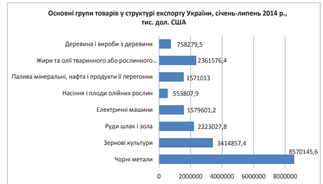
Рис. 3. Основні групи товарів у структурі експорту України, січень-липень 2014 р., тис. дол. США

су – руда та чорні метали, та продукція сільськогосподарства, і необроблена – пшениця, кукурудза, насіння соняшнику, і оброблена – соняшникова олія [7].