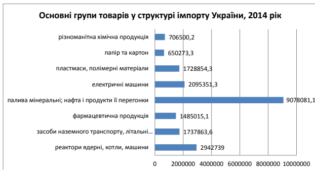
Рис. 4. Основні групи товарів у структурі імпорту України, 2014 рік

Висновки. Інтеграція України у світовий економічний простір дає змогу вийти українським виробникам на нові ринки збуту та збільшити загальне виробництво і експорт. Перед Україною стоїть складне завдання – влитися в єдиний європейський економічний простір. ЄС надав преференції в торгівлі, але, на жаль, українська сторона в експорті товарів ще не скористалася належним чином цією перевагою, натомість в експорті послуг ситуація кардинально відрізняється. Експорт товарів за перше піврччя 2014 року порівняно з аналогічним періодом 2013 року скоротився на 14,2%, імпорт знизився на 20,2%, сальдо зросло на 17,1%.