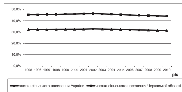
Рис. 1. Частка сільського населення України та Черкаської області

сільського та зростання частки міського населення України. Причому цей процес відбувається з причин як природного скорочення за рахунок дисбалансу народжуваності та смертності, так і міграції. Хоча останнім часом в сільській місцевості фіксується деяке поліпшення ситуації з народжуваністю, проте високий рівень смертності, що перевищує рівень народжуваності в усіх регіонах України (за виключенням Рівненської та Закарпатської області), вказує на від'ємний природний приріст населення й залишається однією з основних причин депопуляції сільського населення нашої держави. Частка сільського населення представлена на рисунку 1, де частка сільського населення Черкаської області в 2010 р. становить 44,1% в порівнянні з 31,4% в цілому по Україні.