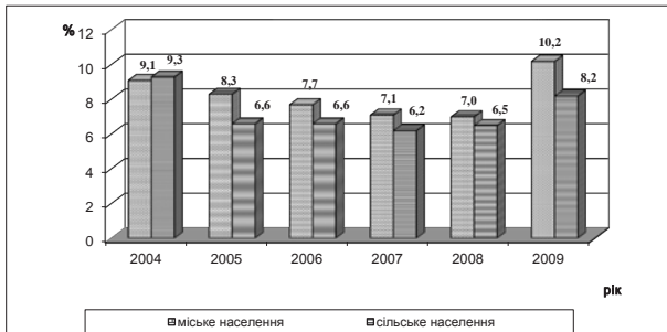
Рис. 3. Рівень безробіття населення працездатного віку (за методологією МОП) за місцем проживання у 2004-2009 рр. (% до кількості економічно активного населення відповідної вікової групи, на кінець періоду) [4]

од трансформаційної кризи, так і в останні роки, а також повільність упровадження ринкових перетворень у сільській місцевості та диверсифікації економіки села, а також за наслідками світової фінансової кризи. За даними Держкомстату України протягом 2008-2009 рр. Рівень безробіття сільського населення працездатного віку за методологією МОП збільшився на 1,7%, рівень безробіття міського населення збільшився на 3,2% (рис. 3).