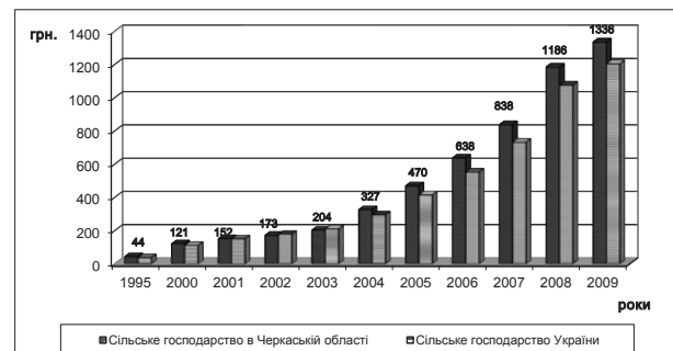
Рис. 5. Динаміка середньомісячної номінальної заробітної плати працівників, зайнятих в сільському господарстві Черкаської області та по Україні у 1995-2009 рр. [3-4]

Зберігає свою значущість чинник мотивації праці працівників села. Низька заробітна плата зовсім не сприяє ефективній праці селян. Для більшості працівників сільського господарства їх доходи не знаходяться в прямій залежності від продуктивності праці, що є одним з чинників загострення проблеми сталості розвитку сільського господарства.