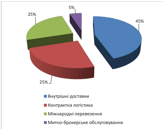
Рис. 3. Структура ринку логістики в Україні

ни і в Одесу істотно ускладнена у зв'язку із зміною кон'юнктури ринку і ускладненням умов діяльності; поставки на Схід схильні до високих ризиками безпеки, як для життя персоналу, так і для збереження транспорту і вантажів.