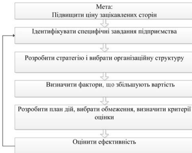
Рис. 1. Механізм створення довгострокової акціонерної цінності

Сутність управлінського обліку полягає у створенні довгострокової акціонерної цінності. У той час як ця структура варіюється від компанії до компанії, є шість загальних кроків – рисунок 1.