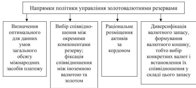
Рис. 1. Основні напрямки реалізації політики управління офіційними резервами країни

Валютна інтервенція є одним з напрямків валютного регулювання, що полягає у втручанні центрального банку у функціонування валютного ринку через купівлю-продаж іноземної валюти з метою впливу на курс національної грошової одиниці.