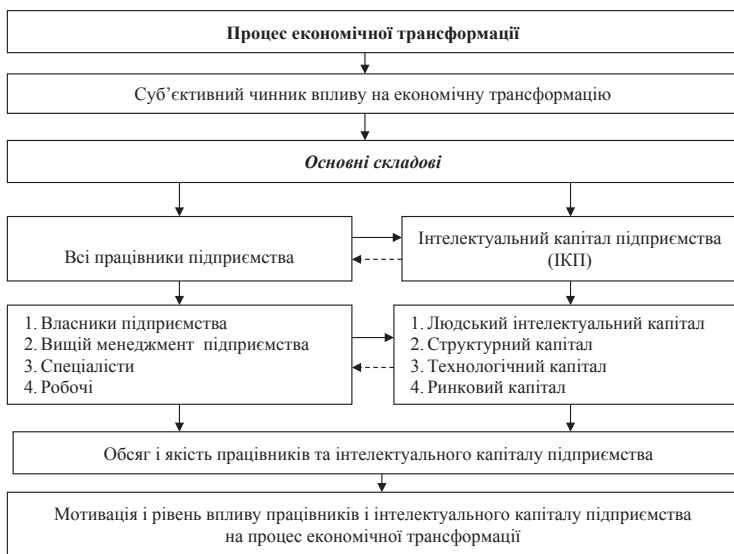
Рис. 4. Роль суб'єктивного чинника підприємства в процесі його економічної трансформації

Другий наголос пов'язаний з передумовами появи такого явища, як економічна трансформація. З цього приводу всі передумови ми розділяємо на два види: