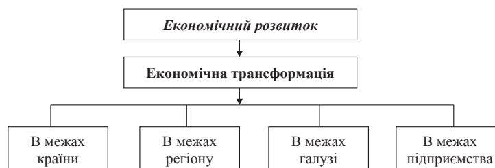
Рис. 1. Основні види економічної трансформації по критерію меж виникнення і здійснення

Перше, на чому хочеться наголосити, це на тому, що економічна трансформація (як і будь яка інша трансформація) здійснюється і має місце тільки в межах економічного розвитку (країни, регіону, галузі, підприємства), що відображено на рис. 1.