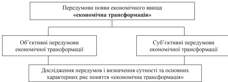
Рис. 2. Основні передумови появи економічного явища «економічна трансформація»