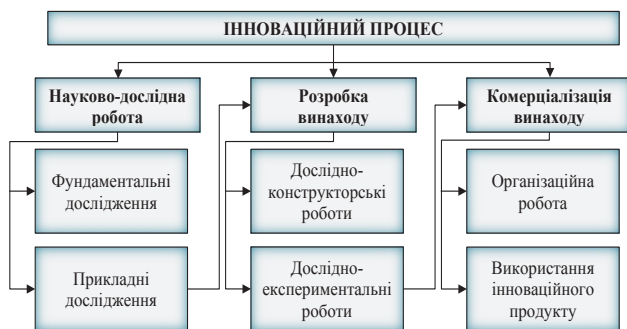
Рис. 1. Етапи інноваційного процесу

Слід відмітити, що комерціалізації інновації передують роботи щодо її підготовки, а саме: одержання наукових знань та їх перетворення у сформований винахід, які в комплексі формують завершений інноваційний процес (рис. 1).