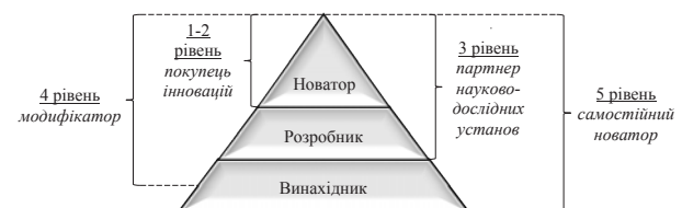
Рис. 4. Класифікація інноваційно-активних підприємств відповідно до виконуваних ними функцій

Відповідно до ступеня самостійності реалізації підприємством етапів інноваційного процесу (обсягу виконуваних ним робіт) можна виділити основні рівні його залучення у інноваційний процес, в залежності від яких варіюється сила та стійкість забезпечуваних конкурентних переваг (рис. 4).