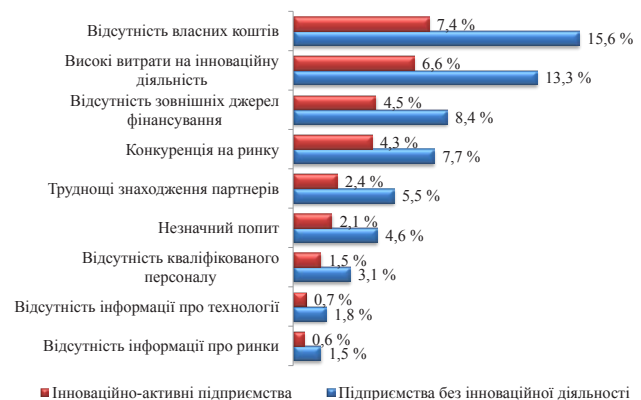
Рис. 2. Розподіл підприємств за несприятливими чинниками для здійснення інноваційної діяльності (у % до загальної кількості обстежених підприємств)

Існує ряд обмежуючих факторів, які спричинюють відмову підприємства від здійснення інноваційної діяльності чи змушують шукати додаткові можливості для реалізації даного типу розвитку. Про це свідчать статистичні дані підприємств України (рис. 2).