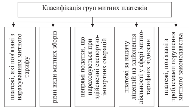
Рис. 2. Класифікація груп митних платежів*

Основні платежі, які нараховуються митними органами, можна класифікувати на декілька груп – рис. 2 [2].