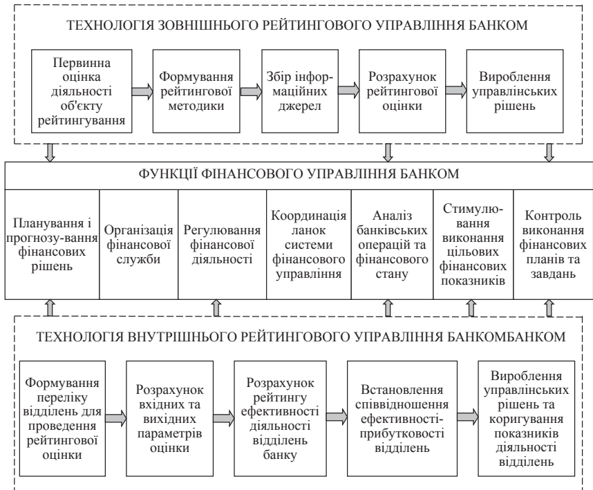
Рис. 2. Технологія рейтингового управління фінансовою діяльністю банку

Технологію зовнішнього рейтингового управління можна представити як послідовність наступних процедур: