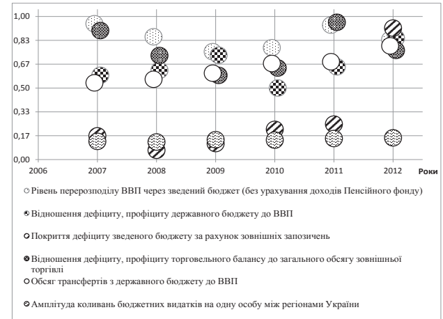
Рис. 1. Результати розрахунку нормованих індикаторів групи бюджетної безпеки за методикою 2007 року

на стабільно небезпечному рівні. При оптимальному значенні 30%, середнє значення за період з 2007 по 2013 складало 109,8%, тобто витрати різнилися у два рази [3].