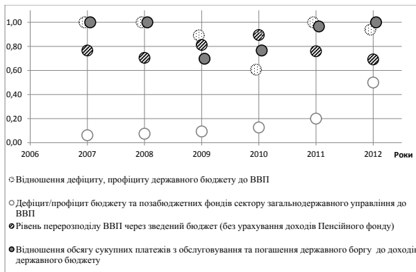
Рис. 2. Результати розрахунку нормованих індикаторів групи бюджетної безпеки за методикою 2013 року

Серед нормованих показників діючої методики (див. рис. 2) найбільший негативний вплив на рівень бюджетної безпеки за розрахунками Методики-2013 року виявив індикатор відношення дефіциту бюджету сектору загальнодержавного управління до ВВП. Необхідно зауважити, що даний показник не знайдено серед періодичної офіційної статистики, хоча його розрахунок є нормою для всіх країн-членів Європейського союзу [13]. Він згадується серед брифінгів міністра фінансів щодо ухвалення бюджету та його виконання. Протягом періоду аналізу дефіцит бюджету та позабюджетних фондів сектору загальнодержавного управління скоротився з 16% (факт 2007 року) до 2,5% (закладено бюджетом на 2012 рік) ВВП. Відмітимо, що фактично, цей показник у 2007-2012 роках не включався до підгрупи показників бюджетної безпеки, так як у розрахунок інтегрального індикатора його було включено лише з оновленням методики у 2013 році. Підвищена увага до цього показника мала позитивний ефект – за результатами 9 місяців 2013 року було відзвітовано про досягнення рівня дефіциту у 5,6% ВВП, що значно нижче минулих значень, проте все ще вище за критичний рівень у 5%.