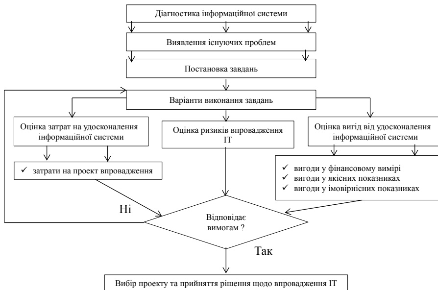
Рис. 2. Алгоритм прийняття рішення щодо впровадження інформаційних технологій [1]

методів. Так, оцінка ефективності від впровадження або удосконалення інформаційної системи здійснюється на основі наступних методів [6]: