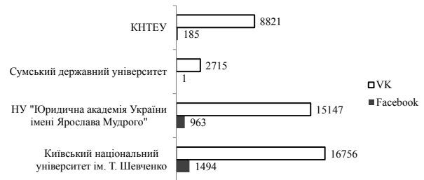
Рис. 3. Порівняння кількості учасників у групах провідних університетів

Висновки з проведеного дослідження. У сучасних умовах зниження витрат на просування бренду ВНЗ