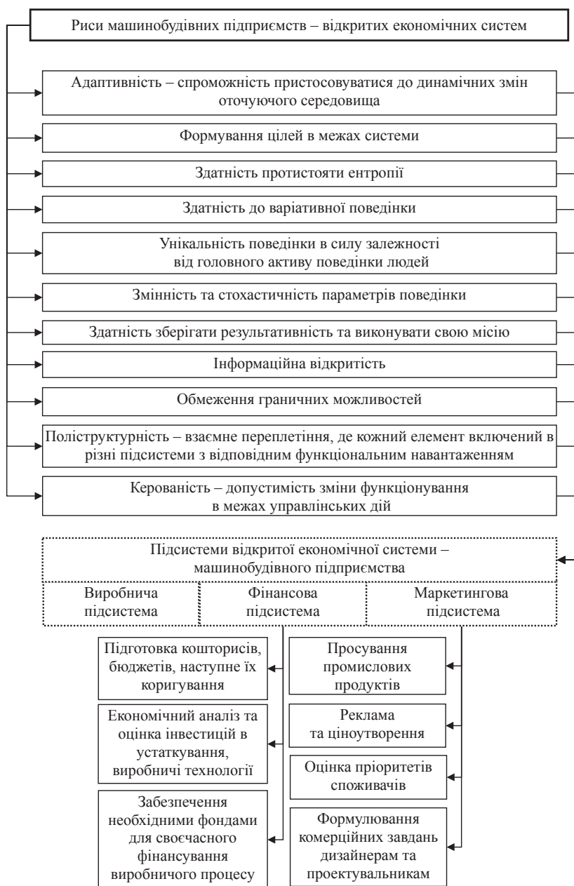
Рис. 1. Місце функціональних підсистем у відкритій економічній системі – машинобудівному підприємстві [3, с. 147-149]