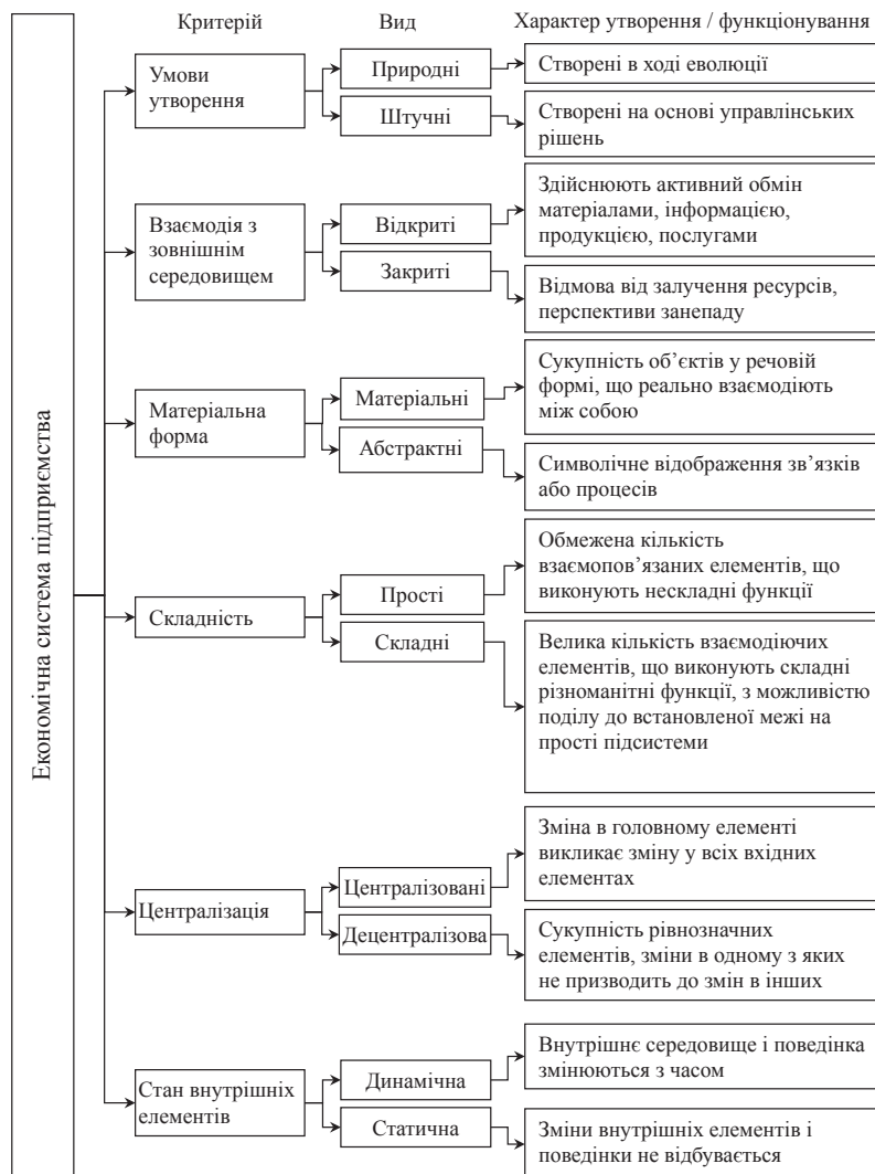
Рис. 2. Класифікація економічної системи підприємства (складено на основі: [2; 7, с. 33-35])

Менеджмент підприємства як відкритої економічної системи в умовах конвергенції у ринкові інститути перетворюється на сучасному етапі у пошук оптимальної, економічно обґрунтованої межі залучення ресурсів оточуючого середовища у господарський механізми суб'єкта господарювання. Необхідність застосування ринкових інститутів та інструментів в якості джерела формування господарських ресурсів визначається їх обмеженими обсягами в умовах динамічного економічного зростання, проблемою ви-