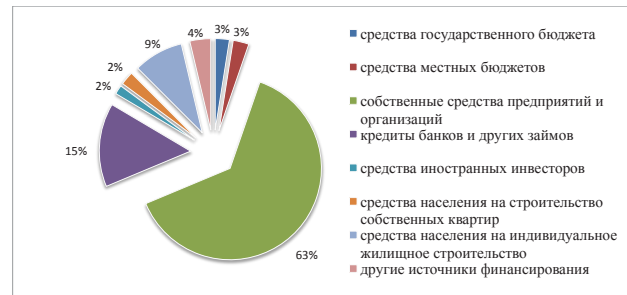
Рис. 1. Капитальные инвестиции по источникам финансирования за январь-декабрь 2013 г.

Так, например, на рис. 1 можно увидеть структуру отечественных капитальных инвестиций по источникам поступления.