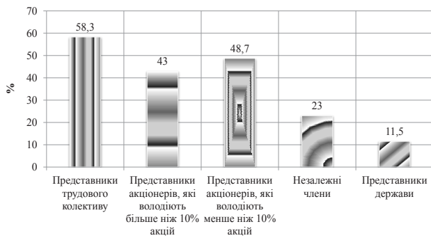
Рис. 2. Розподіл членів наглядової ради за представництвом, % АТ, у яких створено наглядову раду, 2000-2010 рр.

«Харківський завод електромонтажних виробів», «Харківське дослідне конструкторсько-технологічне бюро холодильних машин» наглядові ради виключно складаються з представників даної групи. Така ситуація в першу чергу пов'язана із способом створення цих акціонерних товариств – шляхом приватизації через першочергове розповсюдження акцій серед трудового колективу.